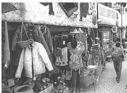
(写真上) 福生武蔵野商店街振興組合の現況

当地域は、これからも「異国の風を感じる地域」として、アメリカの風情を活かし、積極的に活用して観光的視点で来街の機会を増やしていく地域となっていくことが求められています。