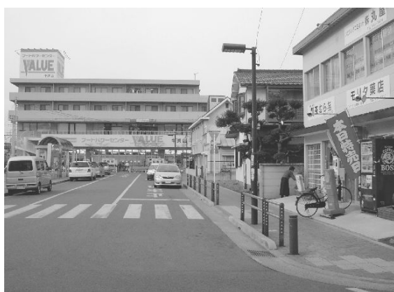
(写真上) 牛浜商栄会の現況

当地域は、このような状況が続くと、本来商店街が持つべき、地域住民への生活支援機能が消失してしまい、様々な悪影響が出てきてしまうことが予想されるため、市民の日常の生活空間として、魅力と秩序ある商業地区を形成していくことが求められています。