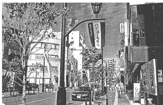
(写真右) 福生商店街協同組合の現況