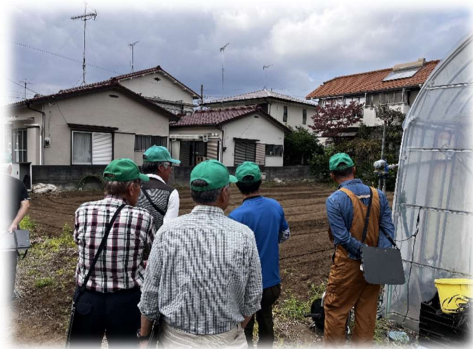
写真：パトロール中の様子

特に相続税納税猶予適用農地をお持ちの方は、適切に管理されていないと判断された場合、相続税納税猶予が打ち切りになってしまうなど税制上の優遇を受けられなくなる恐れがあります。今後も農地の適切な管理をお願いいたします。