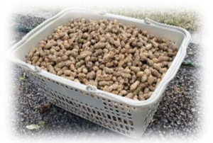
写真：収穫した落花生