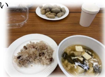
写真：農協女性部の皆さんが作った落花生料理

参加者の皆さんからは「試食会もあり、楽しかったです」「直売所でも生落花生を購入したい」「農作業の大変さ、ありがたさに気づかされました。」等の意見をいただきました。来年度も開催予定となっておりますので、引き続き皆様のご協力をよろしくお願いいたします。