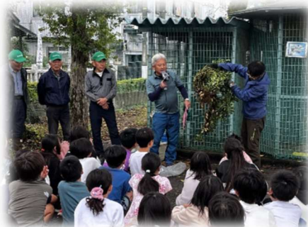
写真：授業中の様子

福生第一小学校4年生の皆さんと、5月に植えた落花生の収穫授業をしました。こまめな除草作業と子どもたちの思いが実り、たくさんの落花生が収穫できました。授業の終わりには、農業委員あてに手書きの感謝状もいただき、とても良い活動となりました。