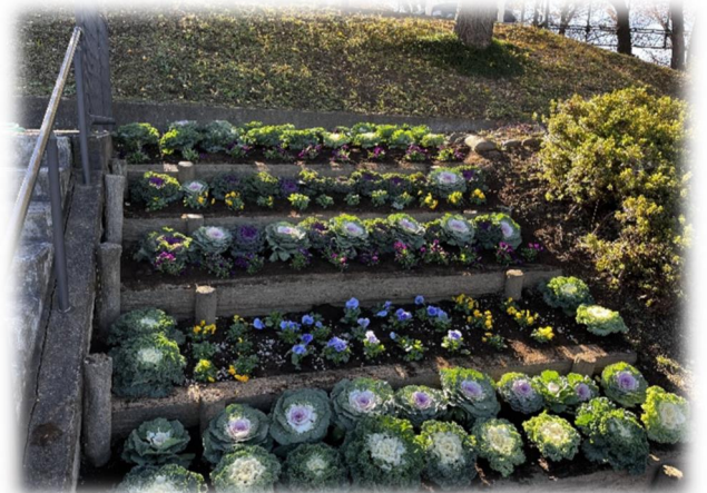
写真：福生野球場の植栽後の様子