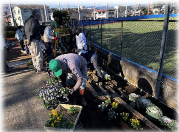
写真：福生野球場での植栽の様子

令和7年11月26日に秋の花いっぱい運動が実施され、市内農業者団体の「グリーンクラブ福生」の皆さんが育てた、パンジー・ビオラ・葉ボタンが市内各所に配布され、街を彩りました。