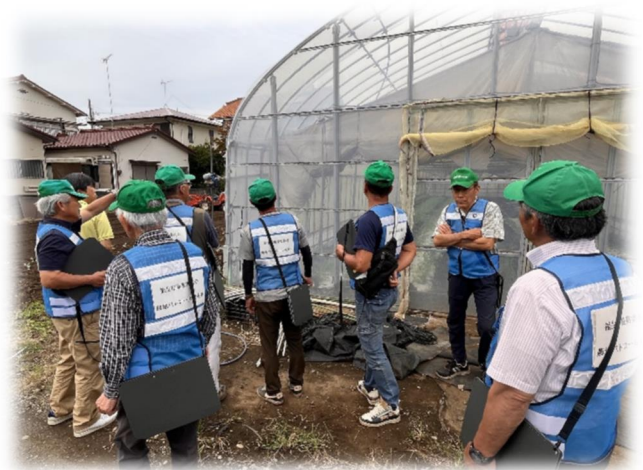
写真：昨年のパトロール中の様子

特に相続税納税猶予適用農地をお持ちの方は、適切に管理されていないと判断された場合、相続税納税猶予が打ち切りになってしまうなど税制上の優遇を受けられなくなる恐れがあります。今後も農地の適切な管理をお願いいたします。