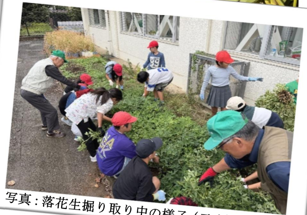
写真：落花生掘り取り中の様子（二小）

令和7年10月8日に福生第一小学校、10月15日に福生第二小学校で5月に撒いた落花生の収穫授業をしました。こまめな除草作業と子どもたちの思いが実り、たくさんの落花生が収穫できました。落花生は5月中下旬に撒き、6月に定植、9月中旬から10月にかけて収穫となります。福生市の特産品でもある、「はっ!ぴー☆ナッツ」(落花生)を皆さんも一緒に育ててみませんか。