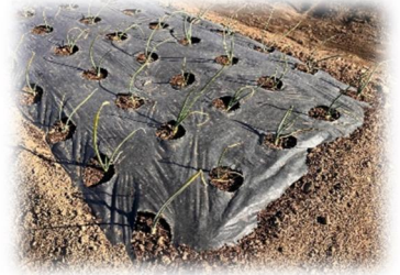
写真：5口マルチに定植された玉ねぎの苗