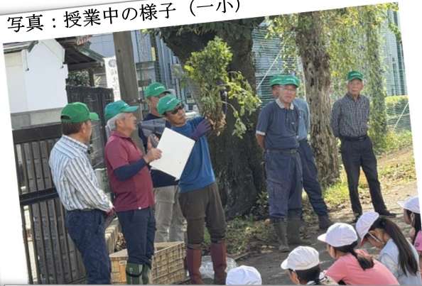
写真：授業中の様子（一小）