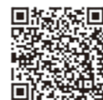
大東京防犯ネットワーク「わんわんパトロール」詳細ページ