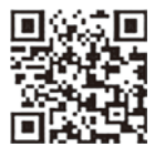
メールけいしちょう

警視庁では、メールけいしちょうや防犯アプリ「Digi Police」で最新の防犯情報を発信しています。ぜひ御利用ください。