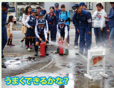
うまくできるかな?