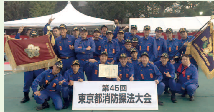
福生市消防団を代表して戦う第三分団

去る、平成27年10月10日(土)、第45回東京都消防操法大会にて優勝を果たした福生市消防団は、今秋開催される第25回全国消防操法大会への出場権を見事勝ち取り、日本一を目指す大いなる冒険への扉を開けることとなりました。