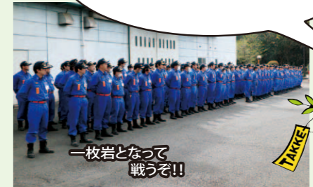
福生市消防団の歴戦の猛者たち