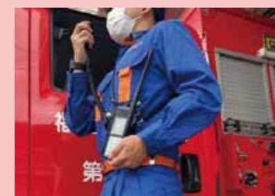
↑携帯型無線機（消防団員や市役所職員が使用します。）