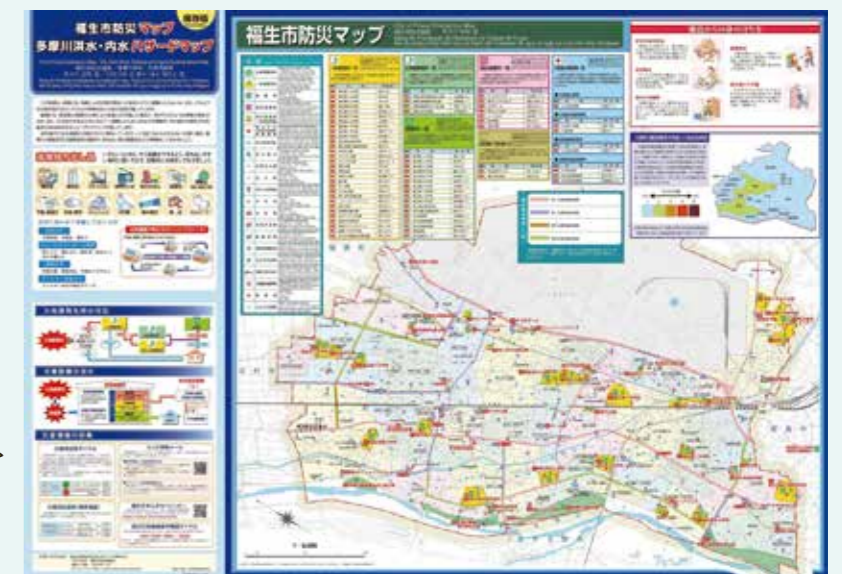
▲福生市防災マップ