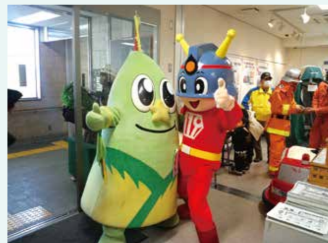
▲ふっさ防災展(福生市プチャラリー)の様子

東日本大震災から10年が経過する本年、自然災害への正しい知識の普及と防災に関する意識啓発を目的としたWebページを、次のとおり公開いたします。下記のQRコードから御覧ください。