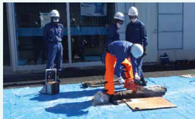
(チェーンソー訓練の様子)

福生市消防団は、新型コロナウイルス感染予防のため、体温測定、アルコール消毒、マスク着用などを心がけています。このことから、市内に火災などの災害が発生した際に迅速な対応ができるよう、感染予防対策をしたうえで訓練を実施しています。