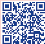
福生市多摩川洪水・内水ハザードマップ公開ページQRコード