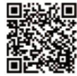
福生市公式ホームページ