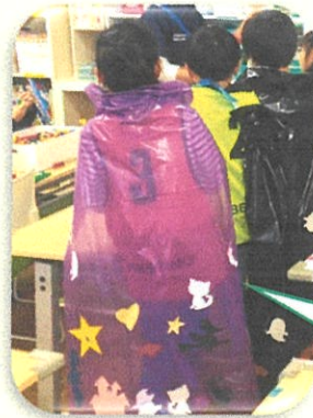
作ったマントを着て 「トリックオアトリート!!!」