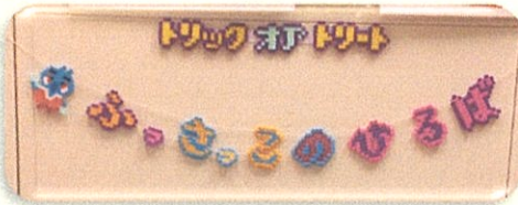
カラーポリ袋を使って ハロウィンマント作り♪