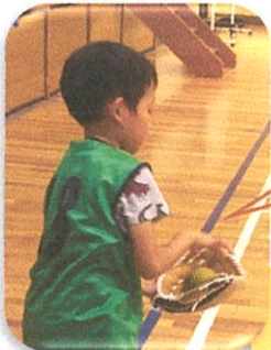
大谷選手からの グローブです!!