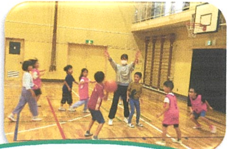
バスケットボール教室