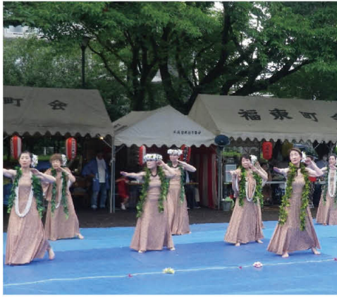
見とれてしまう「フラダンス」