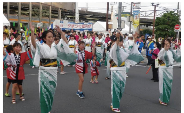
浴衣で優雅に「七夕まつり流し踊り」

焼きやホットドック、アイスクリーム作り、スイカ割りやミニゴルフ等で暑さから解放された一日をエンジョイしました。(2面につづく)