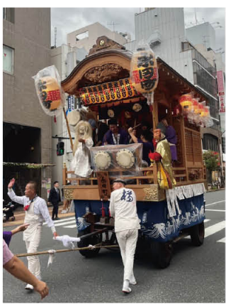
秋開催でも神輿や山車は変わらずに街中に熱気を届ける。

題はありましたが、夏の酷暑を避けられたことはとても良かったという意見が数多く寄せられました。