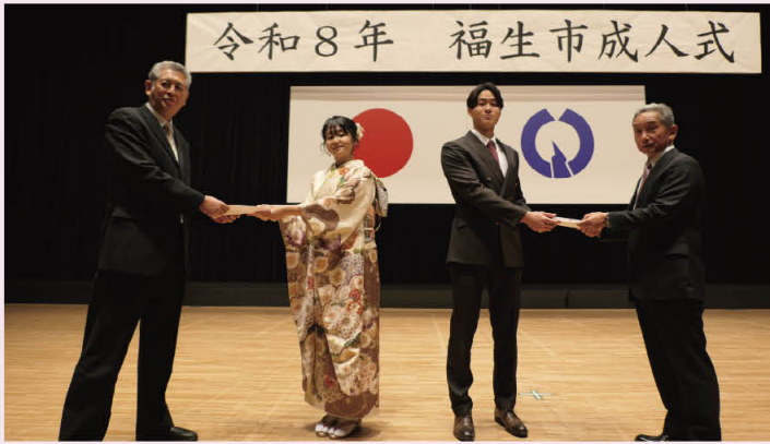
※成人式終了後、成人式実行委員会の方々に撮影のご協力をいただきました。