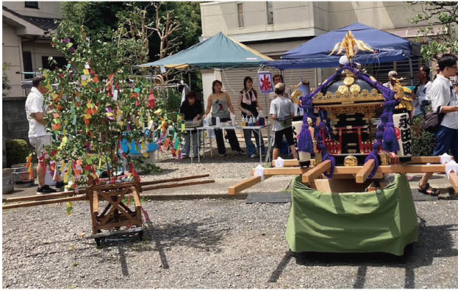
神輿・山車が休憩できる御旅所はとても有難い存在

また、神輿、山車が立ち寄る御旅所は、それぞれの家庭のご厚意で、食事や飲み物などを用意していただいています。 少子高齢化についてはどの町会も検討を進めているところだと思えます。樽神輿や山車も町会以外の方々の応援があつて初めて運営できるようになってきています。前述の年番制度や御旅所のこと今後検討していかねければならないと思つています。ただ永田町会が丸となつて取り組むことができた今回の祭礼を、形を変えながらも続けていくことが大切だと考えています。