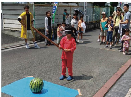
暑さを忘れて満喫「ミニ縁日」

毎年「七夕祭りの流し踊り」には大人も子供も揃いの浴衣で参加、福生駅前から集団で踊り抜きます。夏には青少年、小中PTAがミニ縁日を企画し、福東会館を全館貸し切りにした特別のイベントを開催、たこ