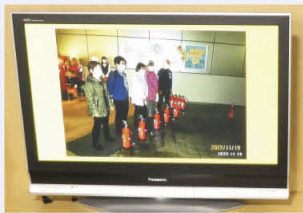
防災研修 (牛浜第二)

町会・自治会を 動画で紹介10月に 福生市役所ロビー 令和7年度は、活性化部 会員が会長を務める南田園 一丁目、鍋ヶ谷戸第一、牛 浜第二、本町、長沢の各町 会の代表的な事業をわかり やすく紹介した動画を放映 しました。今年も10月に放 映予定ですので、是非ご覧 ください。