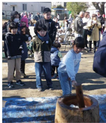
早く食べたい「餅つき大会」

お正月には「餅つき大会」を開催しています。朝から皆で餅をつき、お雑煮やあんころ餅、きなこ餅を食べ、新年会でお正月を祝います。このように一年間を通して伊ベントを運営し、更に交通安全活動・花の植栽・防災防犯訓練などを行っています。今後も「安全で安心して暮らせるまち」「防災意識の強いまち」づくりを目指してまいります。