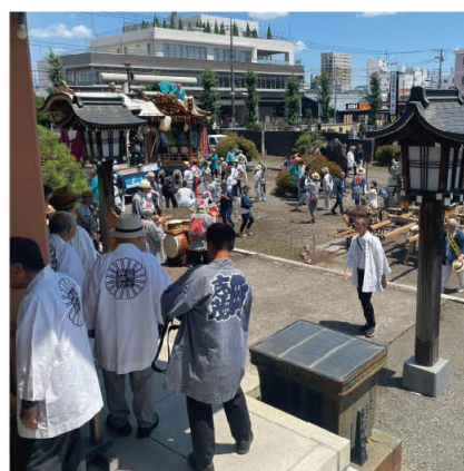
八雲神社祭礼に集う人々

また、町会・自治会の重要な役割の一つである消防団の維持・支援についても触れておきたいと思っております。市内には消防団が五分団あり、各ブロックに一分団ずつ配置されています。 図（次項）では、ブロック別に色分けしています。