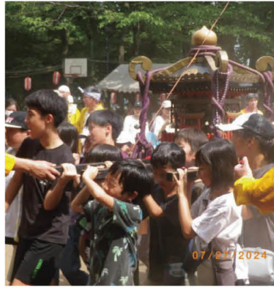
元気のいい「子供神輿」

「秋まつり」は2日間の開催を企画し、1日目は子供フェスティバルとして、パン食い競争や〇×クイズ、射的コーナー、スーパードールすくいなど、夜はナイアガラ等の花火大会で大賑わいでした。二日目はお囃子やお神輿、フラダンス、お楽しみ抽選会、盆踊りを開催、ヤキソバ、フランクフルトが振舞われ、お祭りを楽しみました。