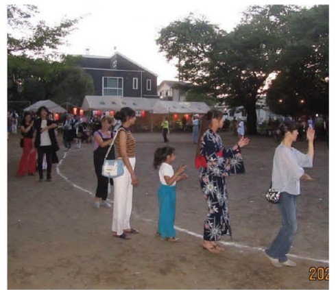
お祭りのクライマックス「盆踊り」

また夏には「ふっさ七夕まつり」続いて「八雲神社祭礼」があります。秋には市内二つの酒蔵が同時に開催する蔵開きで蔵元以外の会場として第三会場が設置されるなど、四季折々のイベントで盛り上がりにも欠きません。また会員の構成も特徴があります。一般会員に加えて商店会員、テナント・銀行・お医者さん・スーパーマーケット会員など、町会運営の強い味方が揃っています。