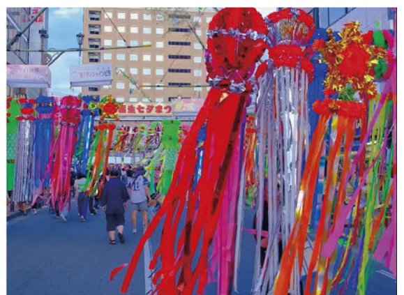
福生駅前通りの七夕飾り