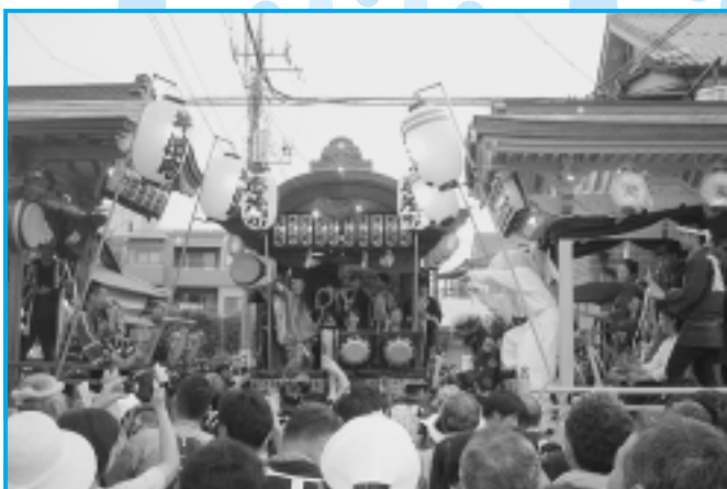
銀座通りの競り合ひ