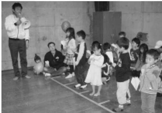
誰が一番遠くに飛ばせるかな？

また、ステージでは、自分たちの作った紙ひこうきを使って、「紙ひこうき飛ばし大会」を行ない、子どもたちと交流を図りました。 ブースにはたくさんのお親子が集まり、いろいろな形の紙ひこうきを作りました。