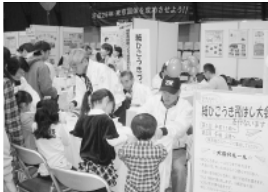
紙ひこうきづくり