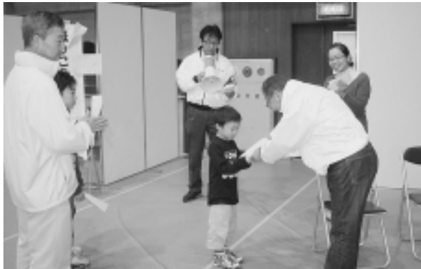
紙ひこうき飛ばし大会 表彰式

活動のパネル展示で、活動のPRを行ない、町会・自治会への理解促進を図りました。 今年度は、ブース内に「加入申込受付コーナー」を設置したところ、この福祉まつりで、町会への加入を決めていただいた方もいらっしゃいました。