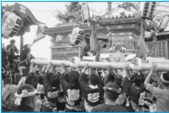
神明社前競り合ひ