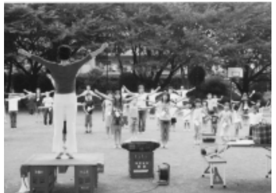
ラジオ体操で健康づくり

12日間、時間は朝6時15分～6時40分でした。12日間の参加者合計は976人。福東公園も毎日、子ども約30人、大人約50人でいっぱいという盛り上がりでした。