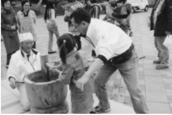
桜の下でお餅つき

そして第三小学校です。行事拠点は福生公園で、特にさくら祭り、盆踊り、夏まつり等を行っています。今取り上げたい行事は、3月下旬か4月上旬に町会独自で開催しているさくら祭りです。福生公園の上には忠霊塔があり、下の公園では各種団体の協力のもと、テントを設置し、焼きそば、おでん、フランクフルト、焼きとりなどを出店し、そして萩会の協力で野だても行います。子供たちはゲーム、カラオケ大会等で一日を楽しく過ごしています。また、昨年から役員で話し合い、暮れの餅つきだけではなく、陽気の良い桜の花の下で子どもた