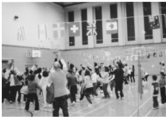
盛り上がった玉入れ

ちに餅つきを、と話がまとまり、役員の指導のもと、安全を確保しながら行なっています。子どもも大人も和気あいあいと笑顔が絶えない行事となり、つきあがった餅を皆で試食し、満足しています。また、桜の木の下では、グループができ、一献を交わしながら、一日中笑い声、話し声の絶えない場となり、コミュニケーションを最大限に取り得ていることを確信しました。私たちが役員は町会の一人でも多くの方に参加していただき、地域の活性化に一段と拍車をかけていくことを誓い合っています。