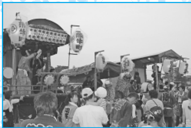
熊川げんき広場競り合ひ