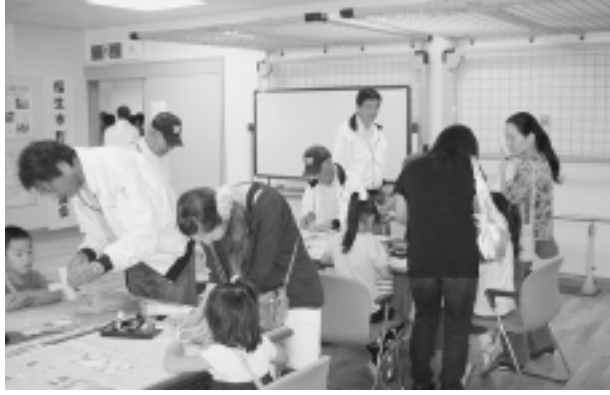
ぶんぶんゴマづくり

町会長協議会では、毎年、福祉まつりやふれあいフェスティバルに参加し、市民の皆さんとの交流を図りながら、町会・自治会の活動紹介や加入促進運動を行っています。