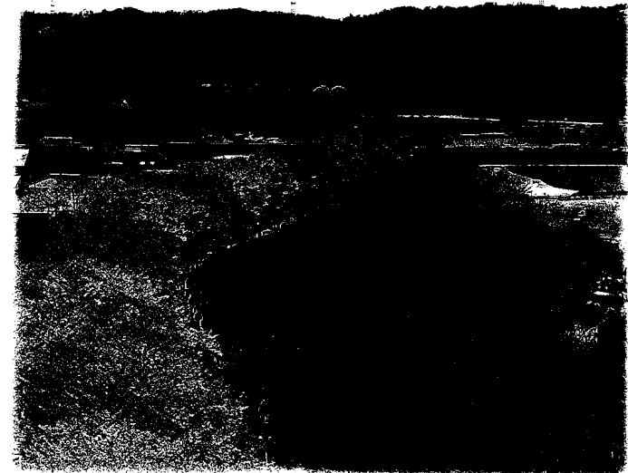
▲春の桜並木と多摩川