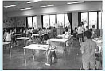
▲田園クラブの児童たち