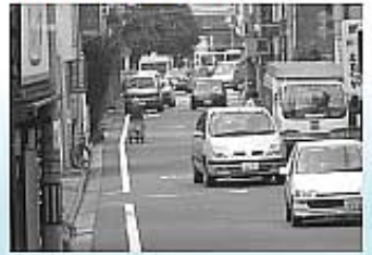
▲富士見通りの通行状況

ドレール設置は難しいが、車道幅員が狭いので、両側の外側線により通行帯を確保している。