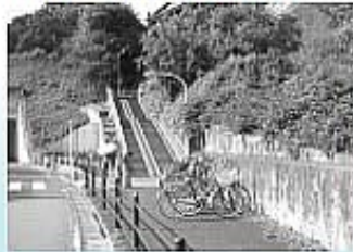
▲旧富士見橋の階段

ロープ部分が老朽化により滑りやすく、歩行者も歩いて滑ったと聞いているので、本年度改修したい。