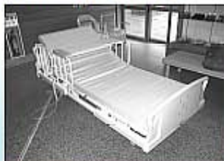
▲介護用の電動ベッド

括支援センターを設置して事業を行っており、今後は大きな成果が残せるのではないかと考えている