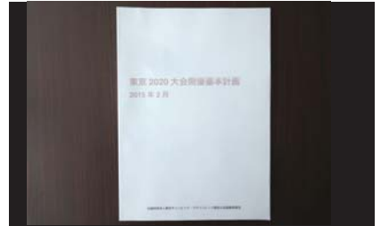
▲東京五輪に向けて策定された2020大会開催基本計画