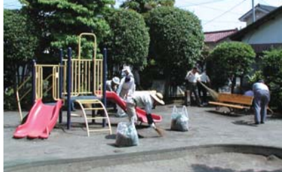
▲公園ボランティアの皆さんによる活動の様子