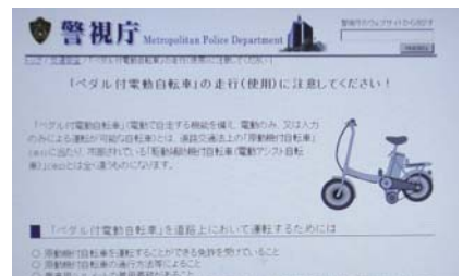
▲ペダル付電動自転車の使用を注意するHP