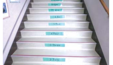
▲階段に英語表示をして学習を（第五小学校）