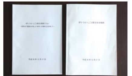
▲平成26年12月に内閣府が発行した冊子