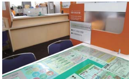
▲生活困窮者自立促進支援事業の窓口