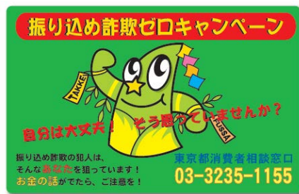
(マグネットイメージ)