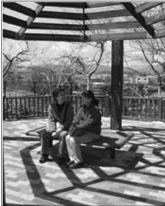
15年度も引き続き整備する下の川緑地(仮称)市民の憩いの場として開放します。