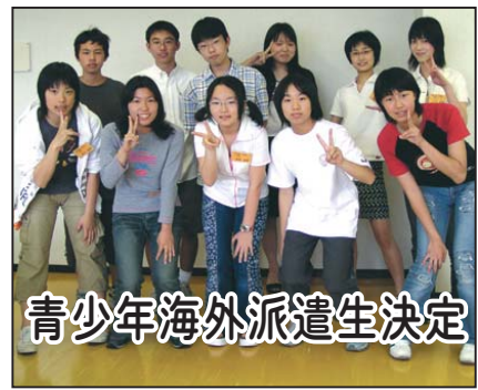
青少年海外派遣生決定

とともに日本の伝統文化を紹介し、相互理解に努めます。また、ブライスクニオン、グラウンドキャニオンでの野外活動等を通して、アメリカの自然について学習してきます。