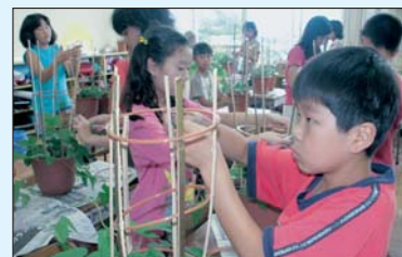
支柱を立てるのは難しいな

販売価格 1鉢500円 事前販売もします。申込みは電話で福生福生第一小学校 ☎551・0046へ。※土曜・日曜を除く。