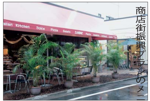
商店街振興プロジェクトのメニューが実現されています

ご覧ください。 http://fussa.cool.ne.jp/kumafuri.html 検索の場合は、ひらがなで「ふっさねっと」と記入してください。