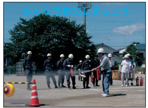
9月1日は「防災の日」で