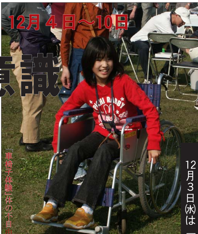
12月3日(水)は「人権週間の相談日」です

「車椅子体験」自体の不自 な方にどんなことを配慮 してあげたらいいのか な一ふれあいフェスティ バルにて