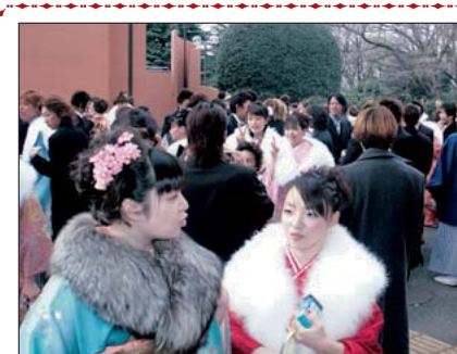
△前回の成人式会場にて