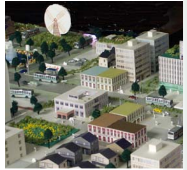
住みたいまちはどんなまち？(昨年のデザインゲームでつくられた模型)

そのため、緑地の保全や緑化の推進などとともに、町並みの整備を進める中で、潤いと調和のとれた、個性ある都市景観の形成が必要とされています。