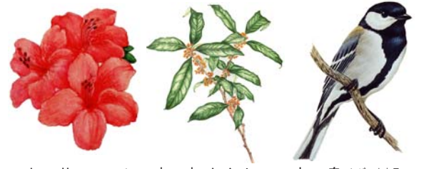
市の花・つつじ 市の木・もくせい 市の鳥・ジュウカ