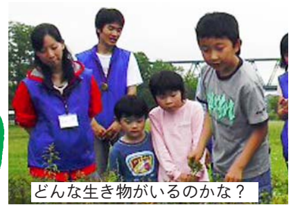
どんな生き物がいるのかな?