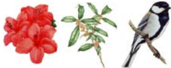
市の花・つつじ 市の木・もくせい 市の鳥・ジュウカ