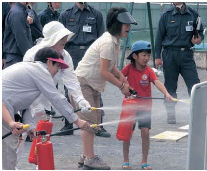
問合せ 総務課防災係

会場 ①福生第一小学校②福生第三小学校③福生第四小学校④福生第五小学校⑤福生第六小学校⑥福生第七小学校⑦福生第一中学校⑧福東グラウンド