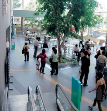
東久留米市役所内市民プラザ