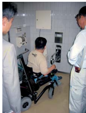
身障者用トイレのてすりの設置には使いやすさが必要