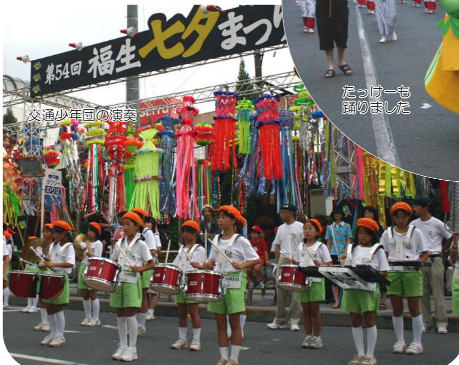
交通少年団の演奏