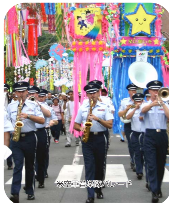
米空軍音楽隊パレード