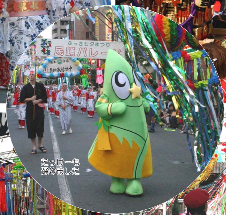
たっけーも踊りました