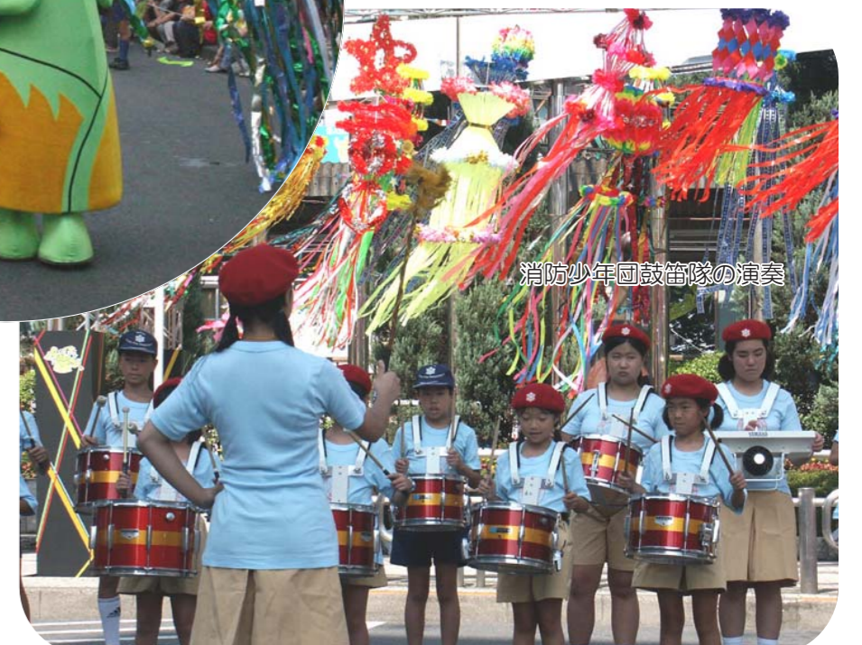
消防少年団鼓笛隊の演奏