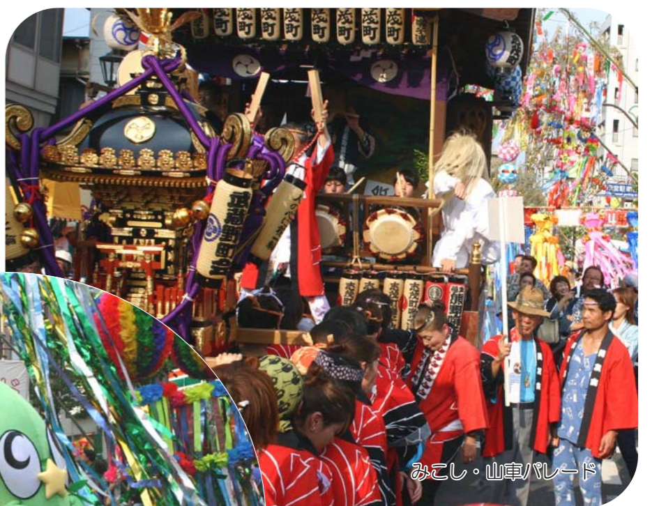
みこし・山車パレード