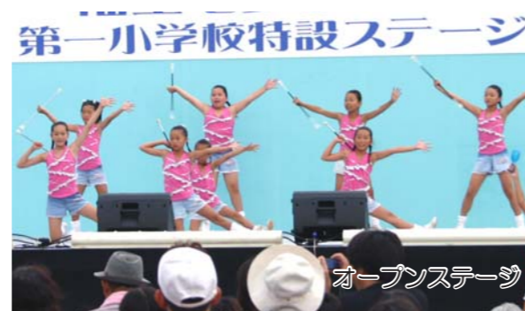
第一小学校特設ステージ