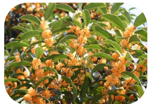
▼市の木「キンモクセイ」