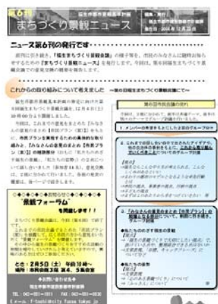
▲「まちづくり景観ニュース」

し尿処理手数料(汲み取り手数料)が改定されます。し尿に係る処理手数料と処理経費との適正化を図るため、7月1日から廃棄物処理手数料を改定します。し尿処理手数料(汲み取り手数料)は次のとおりとなります。 ■事業活動または不特定多数の者が使用する便所 収集回数1回につき「5,000円」を「8,000円」に改定します。 ■一般世帯が使用する便所 収集回数1回につき「2,000円」を「3,000円」に改定します。 未水洗化世帯につきましては、水洗化への早期切り替えをお願いします。また、