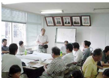
▲まちづくり景観会議

公募により参加していただいた28名の方により、昨年5月から福生まちづくり景観会議で検討が進められてきました福生市都市景観基本計画の市民プランがまとまりました。このプランはまちの景観を整備、保全するための