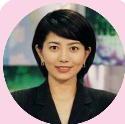
草野満代(くさのみつよ)さん TBS「筑紫哲也NEWS23」 キャスターほか講演活動や エッセイの執筆など、幅広く活動中。