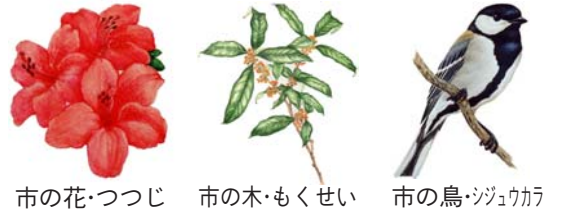
市の花・つつじ 市の木・もくせい 市の鳥・ジュウカ