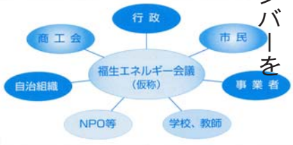
福生市地域新エネルギービジョンより

「地域新エネルギービジョン」の策定にあたっては、福生市エネルギービジョン市民会議を開催し、市民の皆さんの意見を参考にさせていただきます。平成17年度は、市民会議を拡大し、事業者、商工会などを含めた福生エネルギー会議(仮称)を開催します。 会議の中では新エネルギー、省エネルギーのしくみづくりとしての事業化を中心に考え、福生らしいエネルギーの可能性を提案していただきたいと思えます。 福生エネルギー会議(仮称)は ・メンバーは無報酬です。 ・会議は月1回、夜7時～9時頃を予定しています。 応募資格 市内在住・在勤・在学の方