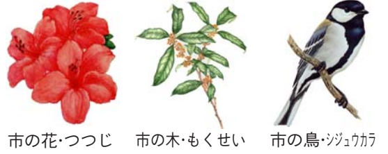
市の花・つつじ 市の木・もくせい 市の鳥・ジュウカ