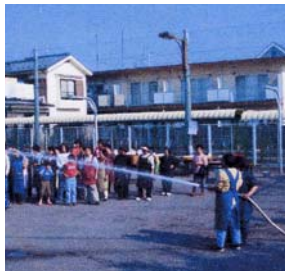
防災訓練に励む自主防災組織の皆さん