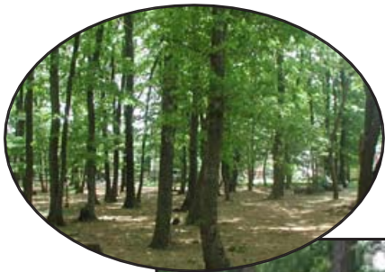
現在の原ヶ谷戸緑地(仮称)