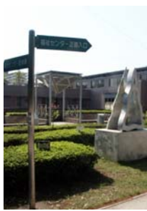
福祉センターでは来 年4月から導入予定

市内の全ての「公の施設」について、改めて施設のあり方を再点検し、指定管理者制度の活用が図れるよう、検討をしていきます。