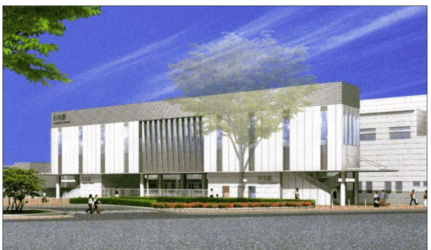
拝島駅北口(福生市)完成予想図

自由通路 幅員10メートル、南北階段にエレベーター、エスカレータを設置し、自転車は引いて通行できます。また、南北階段下にバリアフリースペースを設置します。 案内誘導 すべての利用者にとってわかりやすく、快適な施設となるように、案内サインやバリアフリー設備を設置します。南北をひとつに結ぶやさしい施設を目指します。