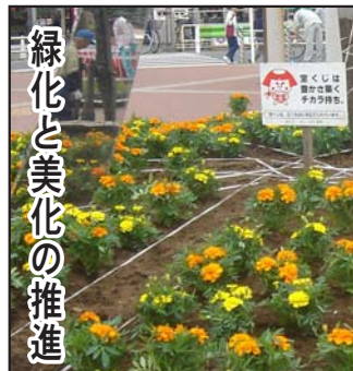
緑化と美化の推進

今年も宝くじの助成金を受け、春の花いっぱい運動が行われ、多くの市民が参加しました。