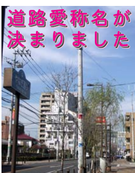
名が愛称道路 決まりました

広報ふっさ平成18年2月1日号で募集をした結果、継続して検討することになった「やなぎ通り」については、その後、協議・調整を経て、そのまま愛称名を残すこととなりました。