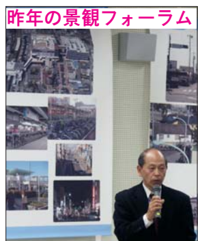
昨年(平成18年)の景観フォーラム

まちづくり景観推進連絡会と市との共催で、市民・事業者と行政が協働して、これからの福生のまちの景観づくりを実践するための景観フォーラムを開催します。