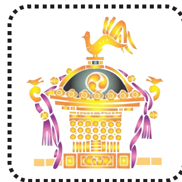
お祭りへの寄付や差し入れ

そのほか病気見舞い、秘書等が代理で出席する場合の結婚祝や葬式の香典、葬式の花輪・供花、落成式・開店祝いの花輪、町内会の集会や旅行などの催物への寸志や飲食物の差し入れ、地域の祭礼やスポーツ大会への飲食物の差し入れ