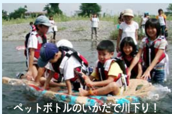
ペットボトルのいかだで川下り！

福生水辺の楽校は、毎月第2日曜日に「多摩川で遊ぼう！」を合言葉に市内の多摩川で自然体験活動を行います。