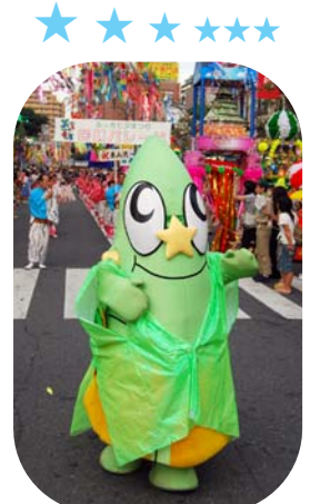
たっけー☆☆も大活躍!