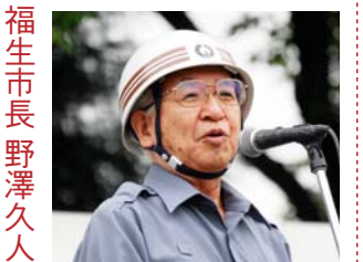
福生市長野澤久人 総合防災訓練にて

携帯電話で市政情報を提供 サービスメニュー→行政→「テレモ自治体情報・マイタウン福生市」