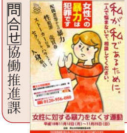
問合せ協働推進課

夫・パートナーからの暴力、性犯罪、売買春、セクシュアル・ハラスメント、ストーカー行為等女性に対する暴力は、女性の人権を著しく侵害するものであり、男女共同参画社会を形成していく上で克服すべき重要な課題です。運動期間中の25日は、女性に対する暴力撤廃国際日と定めています。