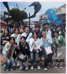
場所 中央図書館2階会議室