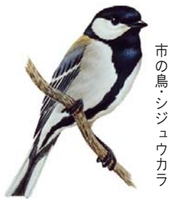
市の鳥・シジュウカラ