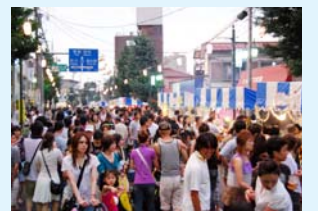
七夕まつりで賑わう栄通り