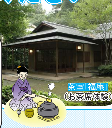
茶室「福庵」(お茶席体験)